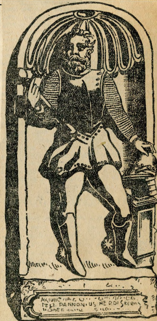
Janus Pannonius relieje a fegyvertárban.