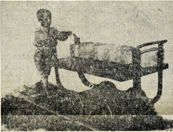
A lőrinci téglagyárban egykor 10 éves gyerekeket is dolgoztatták.