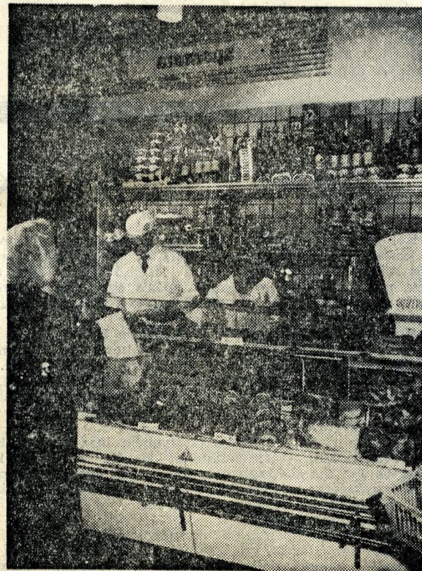
A régi kis szatócsoportok helyett modern ABC-áruház várja a vevőket.