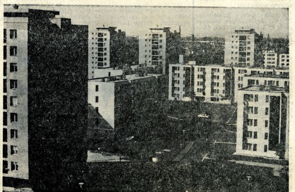
BUDAPEST EGYIK LEGSZEBB ÚJ LAKONEGYEDE A LAKATOS-TELEP, HATALMAS PARKJAIVAL, MODERN ISKOLAJÁVAL, ÜZLETEIVEL