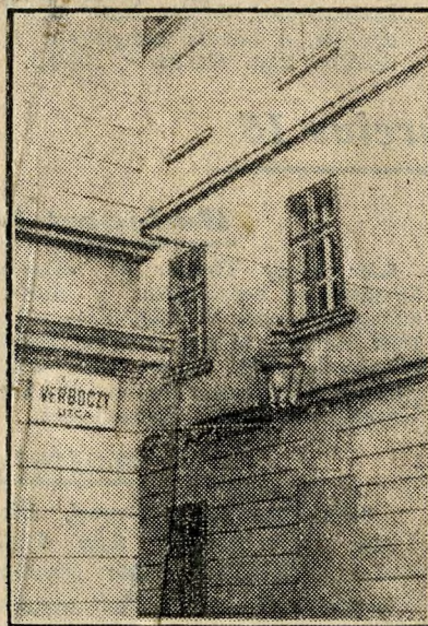
Kossuth másik börtönének ablakai

Az az érzés, mely Thomas Mannt Tolttenger partján elfogta, szorogtat bennünket Budapesten, ahol a budai hegyek és a két síksága, a történelemnek ez a bizonyosságai mellett, mint csak ennek a történelemnek a bizonyosságai állanak a házak,