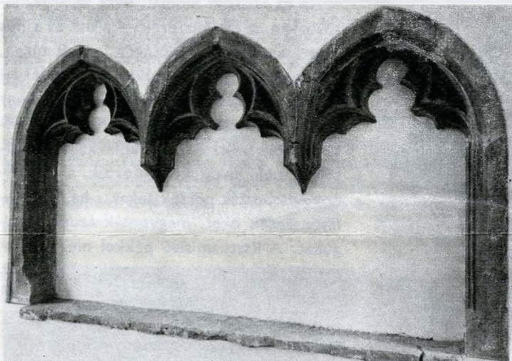
Gótikus ülőfülke a budai Várnegyedben.