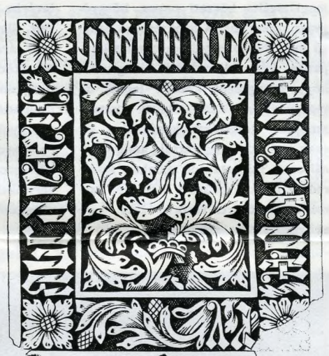
Gótikus ábécé bronzvésete. Egy XV. századi budai ötvös műhelyéből. 1981. évi budai lelet.

tikai díszek meg Buda pompás alakos-címeres sírkövei. Díszkályhásaink ember- s állatábrázoló művészetét 14—15. századi — a palotában feltárt — kályhacsempék hirdetik. Elevenen őrzik gölöncsérek, fazekasok emlékezetét az ásatások során ezerszámra feltárt cserépedények: palackok, poharak; vízvezető cserépcsővek, perseyek, téglák, padlótéglák. Máztatlan és mázas, színes tetőcserepeink között — a budai palota területén, a hajdani nyéki vadászkastély s a pálos főkolostor romjai között — aranyfüsttel befuttatott darabokra is akadtunk. A helyi készítésű és importált üvegedények, színes virágmintás ablaküvegek mellett poharak, palackok, játékgolyók vallanak a hajdani üvegesek — a vitriparok — művészetéről. Csontfésűk, csontból faragott miniatűr illatszeres, parfügiumot tartó csonttégelyek, agancsból készített evőeszközök (főként késnyelek), játékkorongok (pionok), szerencsekockák — néhai csontfaragók, csontesztergályosok és „olvasógyártók” remekei. Előkerült — pár éve, a budai palotaásatások során — néhány remekművű csont övcsat is.