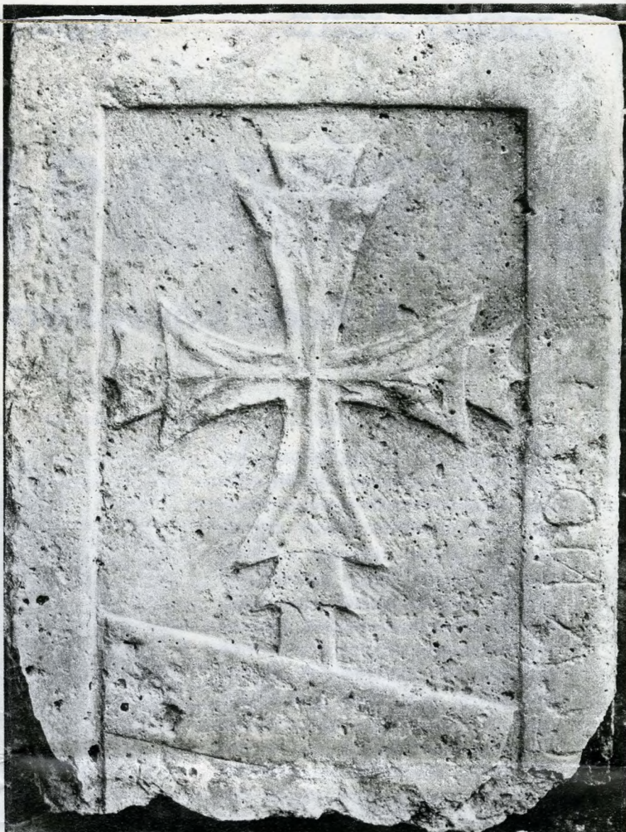
XIV. századi budai sírkő. 1979. évi lelet.

tották őket. A Dunán s a „száraz úton”, tehát kocsin, szekéren szállított árukat egyaránt megvámolták.