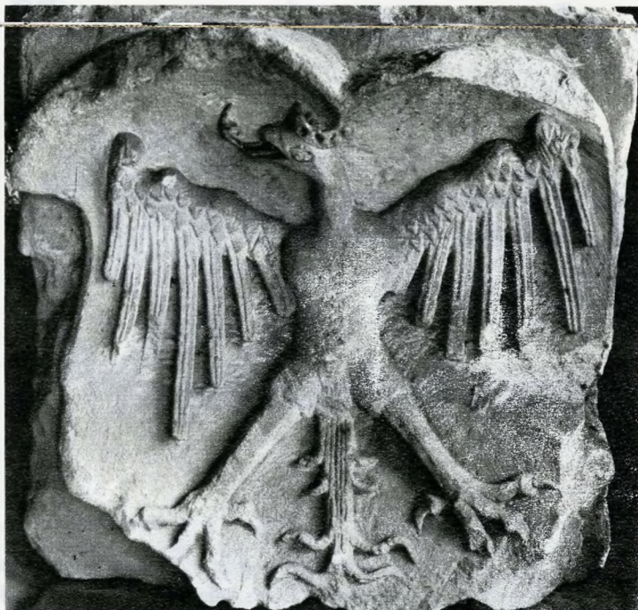
A Jagelló-ház kőcímere. Budavári lelet.