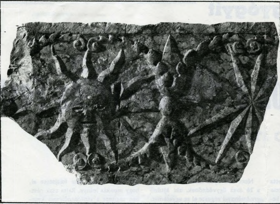
Reneszánsz kőkeret töredéke. 1970. évi budai lelet.