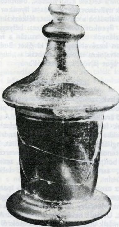
XIII. századi üvegpalack egy budavári kőház pincéjéből, 1973. évi lelet

nak vámtételeit már 1255-ben megszabtta a városalapító, IV. Béla király. A 14. század végén leírt Budai Jogkönyv pedig meghatározta az árusítás módját, óvta az áruk, elsősorban az élelmiszerek — a hal és a hús meg a kenyér — minőségét. Jaj volt annak, aki romlott halat, borsókás húst árult! Jaj annak, aki hamis mérleget használt, vagy megrontotta a kenyeret! A tanács fenyítése gyors volt. A csaló kofákkal s hamisítókkkal nem sokat kukoricáztak, a helyszínen elkobozták portékájukat, s ha újra csaláson érték őket, megvonták árusítási jogukat. A liszthamisító pékkel még cifrában jártak el: megmártogatták a Duna hűs vizében.