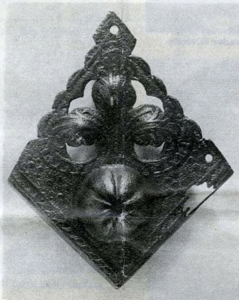
XV. századi bronz könyvsarok a budaszentlőrinci pálos kolostorból. 1973. évi lelet.

Középkori fővárosunknak hetenként három piacnapja volt, s évente kétszer csaptak országos vásárt falai közt. A tatárjárás után felépült új fővárosunk, Buda piaci áru-