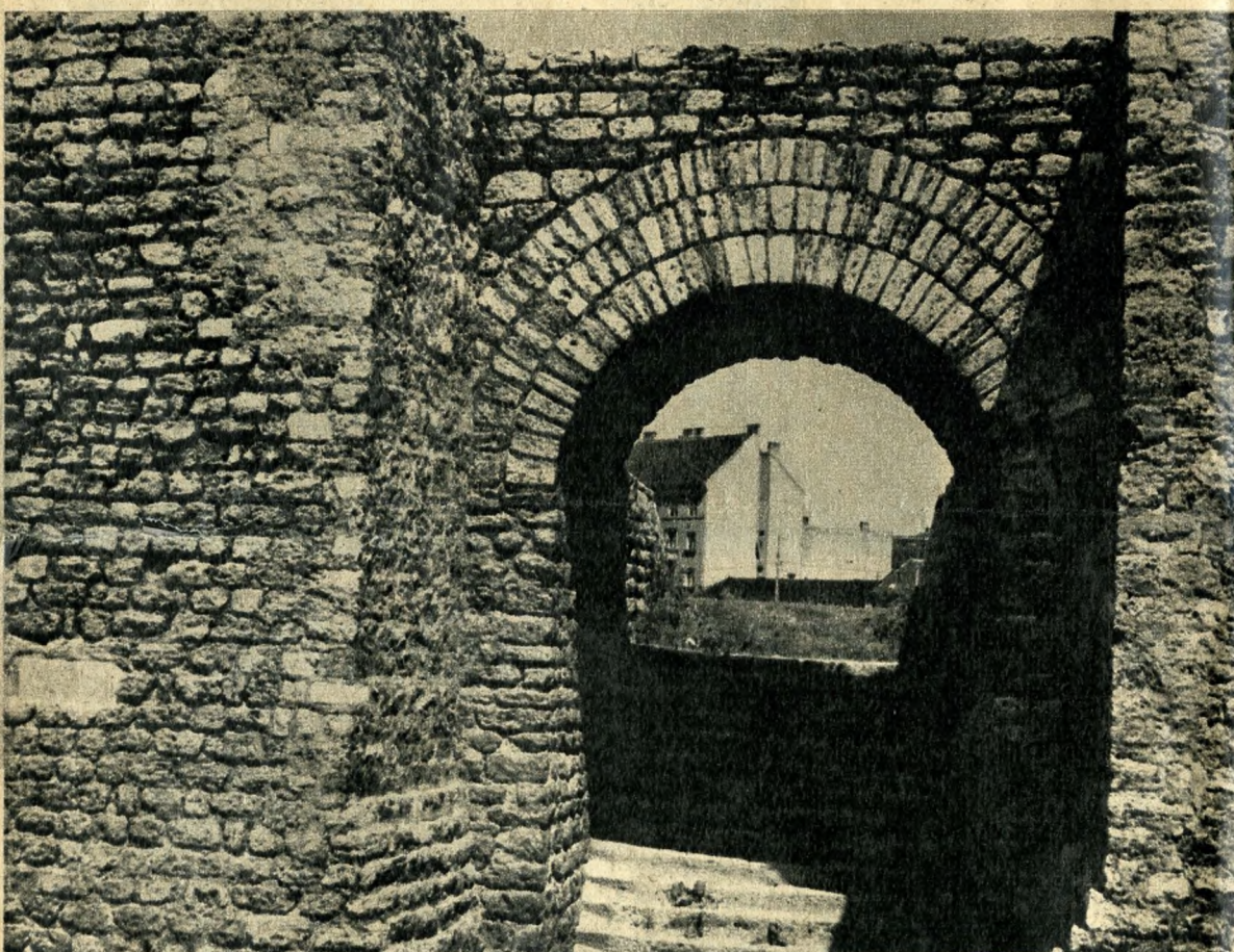
Római amfiteátrum kapujában. Lent jobbra: Krúdy Gyula emlékszobra

Az egyik arca a romantikáé: girbe-görbe utcácskák, egymásba gabalyodó apró házak végtelen sora, ahol az udvarok mélyén leander bókól, a macskaköveken konflis kocog és a kiskocsmákban a pörkölt mellé jóféle savanyú bort lehet iszogatni. Így él Óbuda a pesti ember lelkében, így bukkan fel Krúdy sorai közül. Vajon ismert még ez az arc ma is, megvan még ez a réges-régi Óbuda? Akit jó sora, mondjuk, a Föld utcába vet, vagy a Dugovics Titusz utca — az egykori Tél utca — tájékára, híheti, semmi sem változott. Az omló vakolatú házacsok úgy baktatnak végig az utak mentén, mint száz vagy kétszáz év előtt. A flaszter között fű virít — nincs erre forgalom —, jó öreg Markó Gyula bácsi, a sarki suszter még mindig foltoztatja az elnyűtt lábbelit, és a sarkon, ahol dús lombú gesztenyék néznek szembe Krúdy Gyula egykori lakóházával, vénasszonyok beszélgetnek. Tényleg nem változott semmi? Hát errefele nemigen. A földszintes házba, ahol egykor az író élt, dolgozott, igaz, új lakók költöztek. De itt él még Gráf néni, jóval túl a hetvenen, ő még beszélgetett vele.