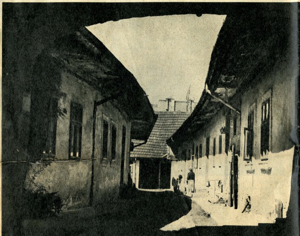
A romantika Óbudája: egy Mókus utcai ház udvarán