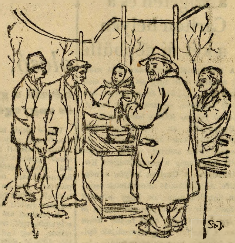
Vidáman kvaterkáznak az emberek a városligeti hóforrásnál.