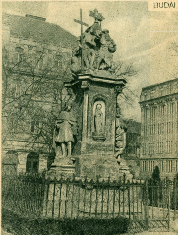
A Zsigmond-téri Szentháromság-szobor.

Ahol a Várpalota-utca a Széchenyi Antal-tér felett betorkollik egy kis sikátoron át az Árpád-utcába, a Várkert falának tetőjéről kis vashíd vezet át a szemközti bérház első emeletére. Ki járt erre a királyi palotából a magánház emeletére, közvetlenül be egy lakásba? A ház ma a Szent Korona tulajdona, de a békebeli telekkönyvek tanúsága szerint Schratt Kataliné volt s ő lakott pesti tartózkodása alatt abban az elsőemeletű lakásban, ahonnan hid vezet a királyi palotába.