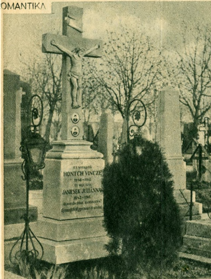
Fényképek a sírkövön.

Az óbudai külső temető specialitása, amivel vidéken is találkozhatunk imitt-amott. A sírkő alatt nyugvó halottak zömancos arcképe díszlik a kövön. Ugy látszik, van Óbudán egy ügyes mester, aki divattá tudta tenni ezt a kegyeletes tiszteletet s aki csak teheti, nem mulasztja el, hogy ne örökítse meg halottainak emlékét.