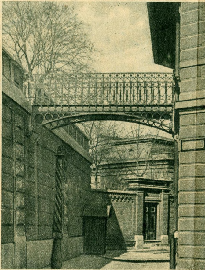
A király hídja.

Ahol a Várpalota-utca a Széchenyi Antal-tér felett betorkollik egy kis sikátoron át az Árpád-utcába, a Várkert falának tetőjéről kis vashíd vezet át a szemközti bérház első emeletére. Ki járt erre a királyi palotából a magánház emeletére, közvetlenül be egy lakásba? A ház ma a Szent Korona tulajdona, de a békebeli telekkönyvek tanúsága szerint Schratt Kataliné volt s ő lakott pesti tartózkodása alatt abban az elsőemeletű lakásban, ahonnan hid vezet a királyi palotába.