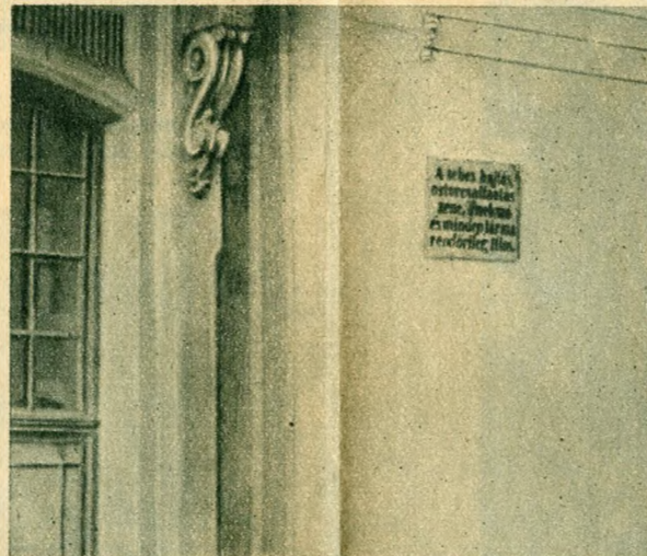
Az alagút esődjé.

A Tabánban és a Vizivárosban elég gyakran találkozunk ilyen házakkal. Jellegetes rajtuk az apró ablak a magasban, amely padlásablaknak látszik. Képzeljük el azonban, hogy még nem vágták a falba a mai rendes ablakokat és ajtókat és akkor előttünk van a régi török ház. A felső kis ablakok a hárem ablakai, melyek azért voltak oly magasban, hogy az utcáról ne láthasson be idegen szem a hölgyekhez.