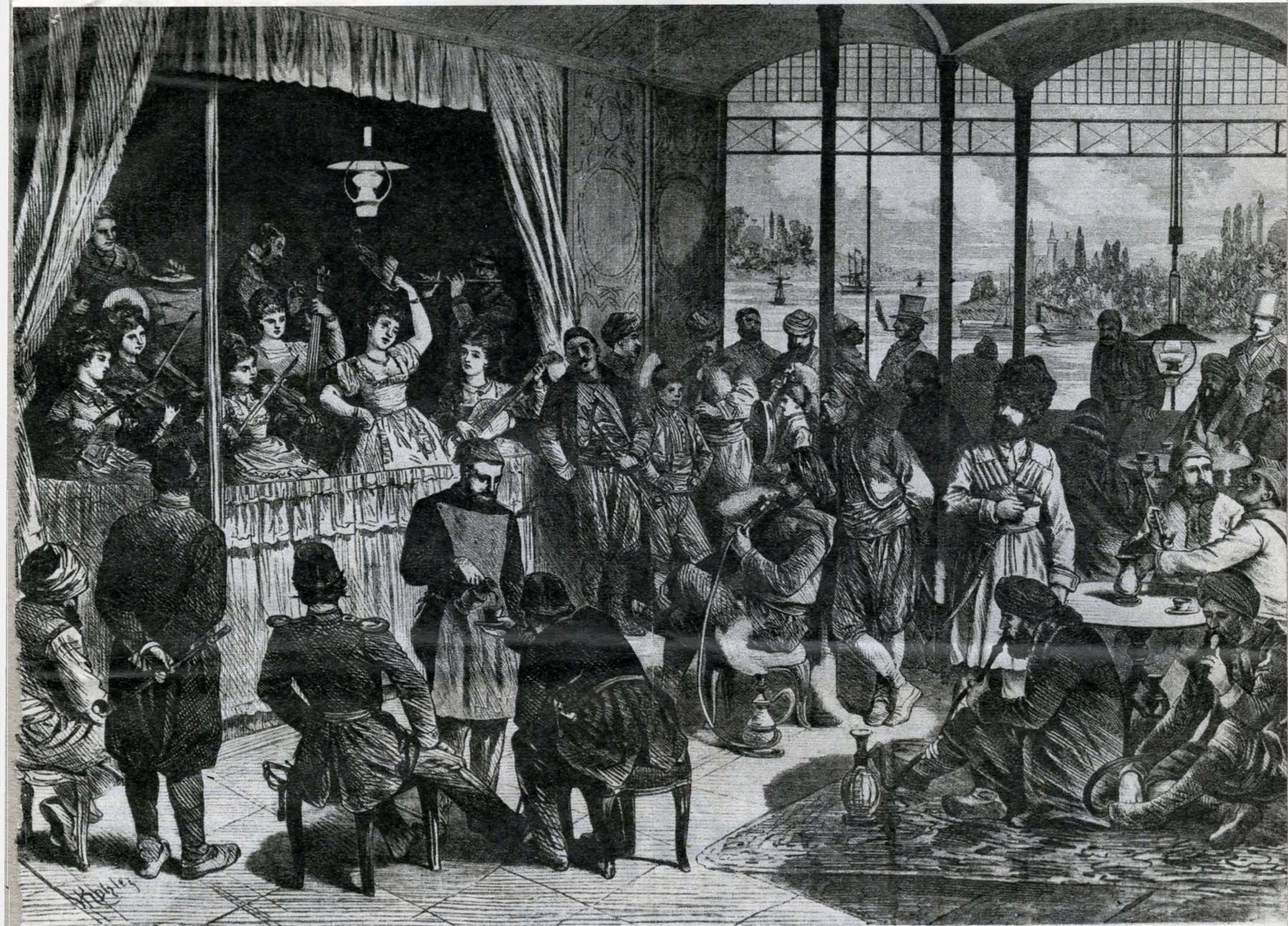
A régi török kávéházakból alakult „café chantant”

ban megszállt — nem helybeli — 7903 vendég közül 2405 volt a külföldi (31%). Legtöbben természetesen Ausztriából érkeztek (1300 fő, köztük 906 Bécsből). A Balkán félszigetről 449, Németországból 360 látogató szállt meg. A Balkánról jöttek közül 200 Romániából, 105 Szerbiából, 61 Törökországból, 45 Bulgáriából, 21 Bosznia-Hercegovinából, 17 Görögországból érkezett.