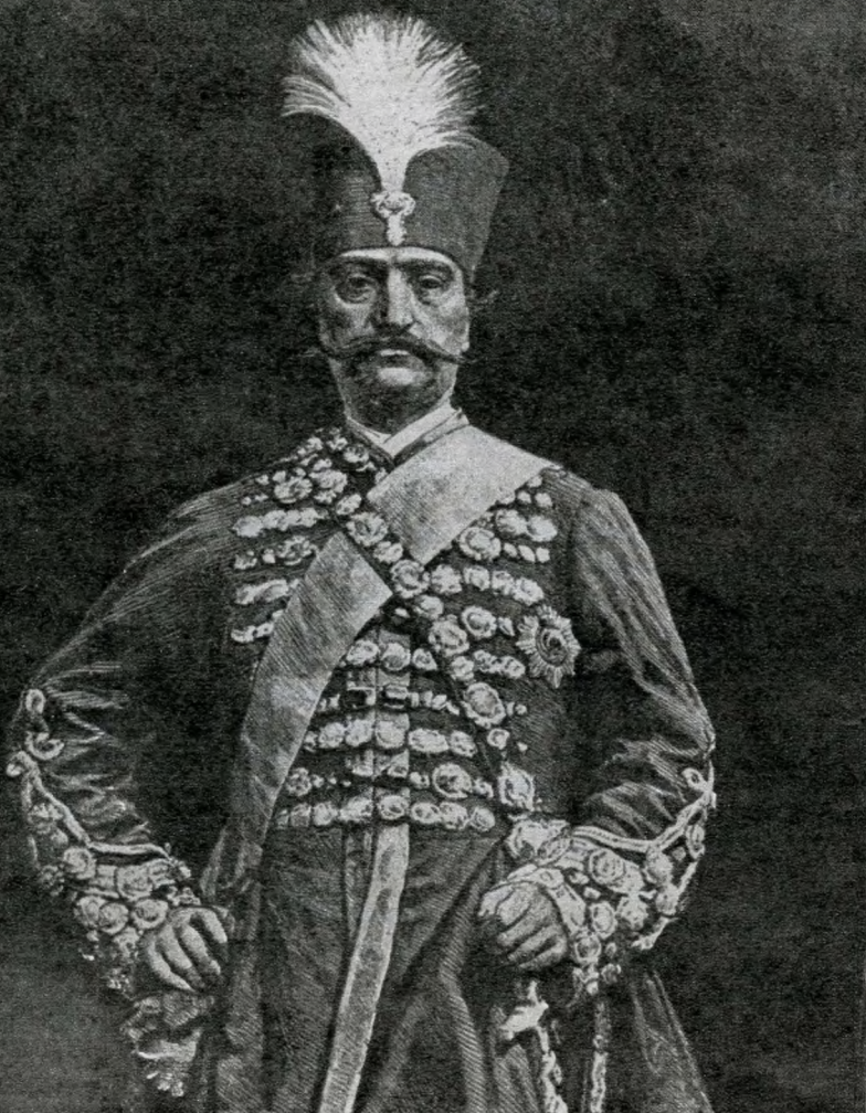
A perzsa sah Budapesten 1889-ben

kezdemenyezésre Baross Gábor , a kor kiváló közlekedésügyi minisztere azonnal felfigyelt. Értesítette a fővárost az érdekelt keleti vasutakkal kötött megállapodásairól. Eszerint a Páris—Bécs közötti gyorsvonati forgalomhoz csatlakozóan a külföldi, de a magyar vasutakon is, körutazási jegyeket adnak ki 40 napi érvénnyel, a Bécs—Konstantinápoly közötti útvonalra. A 40 napon belül az utazást tetszés szerint — így Budapesten is — meg lehetett szakítani. A tárgyalásokon elhangzott ígérek szerint rövidesen mérsékelt áru menettérti jegyeket adnak ki Budapest és Konstantinápoly között.