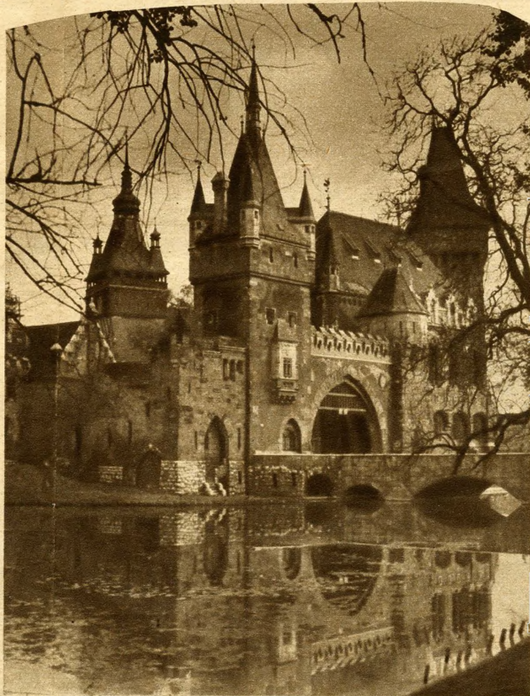
A városligeti Vajdahunyad-vára, ahol a Mezőgazdasági Múzeum van

A kukoricatermesztés gépesítését bemutató modellek (Karfi István felvételei)