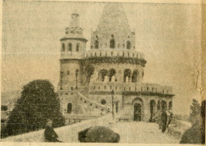
"Fiskarens bastion" i Budapest.

Med skandinaviska fosterföräldrar på besök hos f. d. krigsbarn