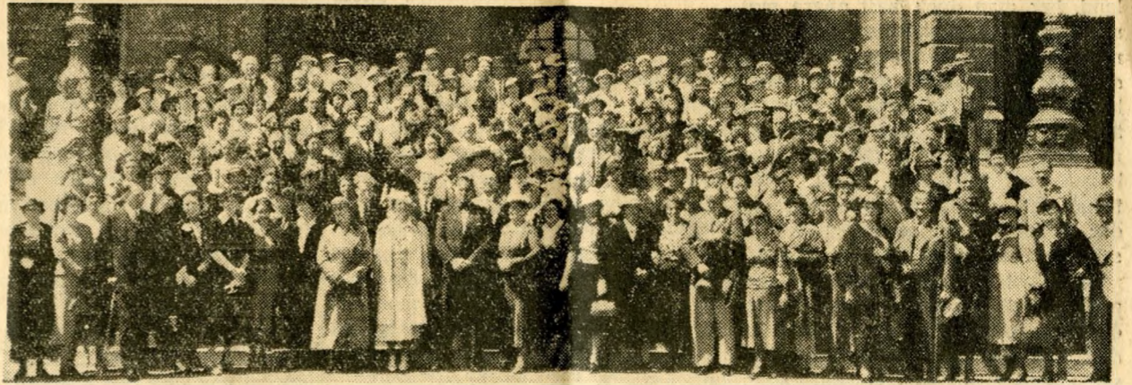
Färdeltagarna på rådhustrappan i Wien.

För att bereda de skandinaver, som haft österrikiska krigsbarn, tillfälle att sammanträffa med sina forna skyddslingar och förnya vänskapsbanden som en gång knötos, hade österrikisk-svenska föreningen i Wien anordnat en sällskapsresa till Österrike, i vilken alla som så önskade kunde deltaga.