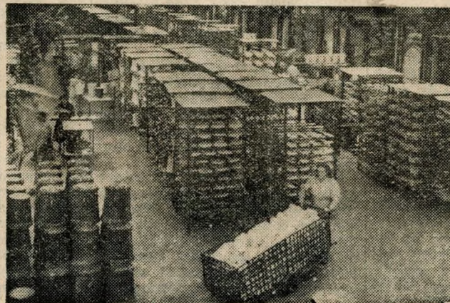
A korszerű szellőzőberendezéssel ellátott zománcműhely.