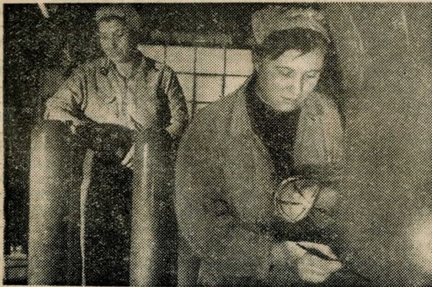
Zománcozzák az exportra készülő gyógyszeripari készületeket.

tását, a savállóan zománcozott vegyipari gépek gyártására pedig csak a felszabadulás után tértek rá. A gyárnak most 1600 dolgozója van, termelése megsokszorozódott.