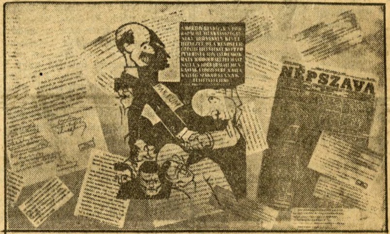
Illegális röpcédula, Peyer és Bethlen gróf kézfogását ábrázolja

a felszabadult Magyarországot mutatja. A Párt, mely a népet diadalról-diadalra vezet, ugyanaz, mely a Tanácsköztársaságot létrehozta, az elnyomatás éveiben a parazsat élesztette, mely megmentette nemzeti becsületünket, függetlenségünket, önálló-