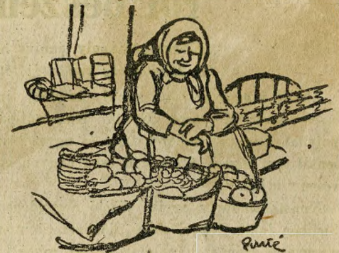
Az árvízi konjunktura hasznélvezője

az új kíváncsiaknak, hogy a szivattyuk a lakások szennyvizével bajlódnak — hogy tetszik