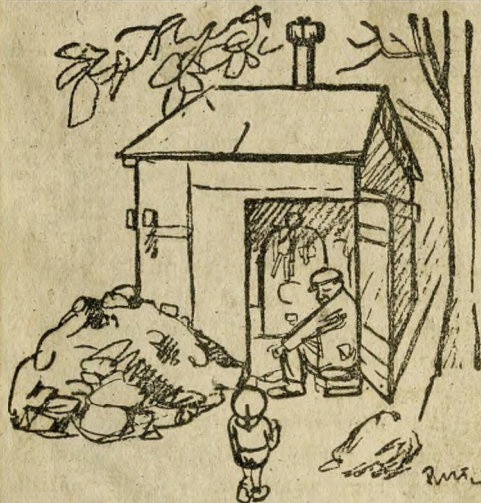
Buda érdekében működik a szivattyú

És a leláncolt uszályok állandóan remegnek, mintha félelmükben a láb rázná őket, fent a stégen pedig nevetve virít a muskátli, és ahol tiszta a fedélzet, ott tarka ágyneműt szellőz-