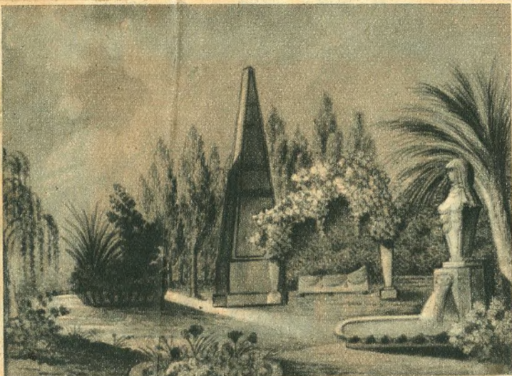
Karl Maurernek, az Eszterházy-udvar színpadi festőjének vázlatkönyvéből: díszletterv Mozart »Varázsfuvola« című operájához