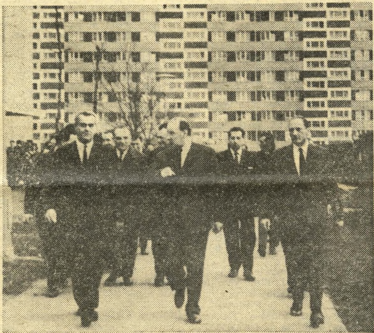
Séta a kelenföldi lakótelepen.