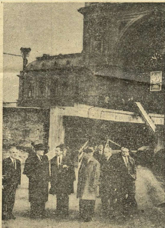
„Tető” alatt a Keletihez vezető bejárati csarnok.