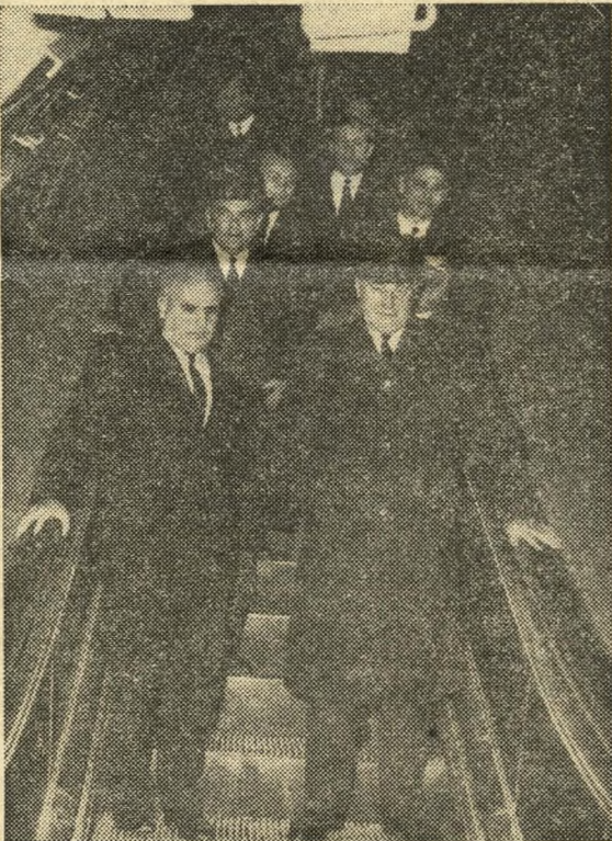
Próbaút a mozgólépcsőn.