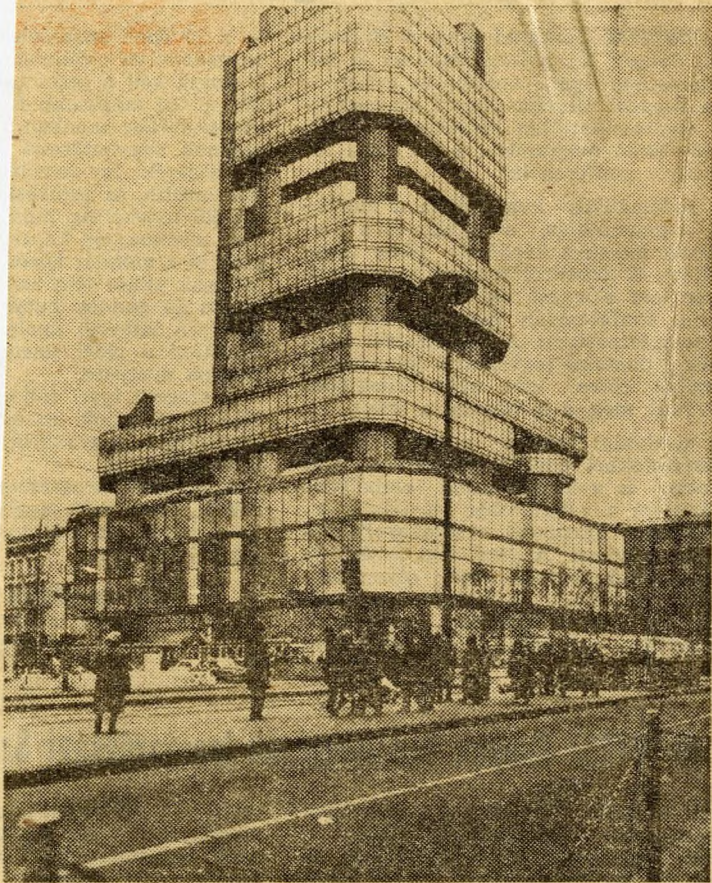
A több mint 100 m magas épület érdekes színtöltje lehet a Belvárosnak