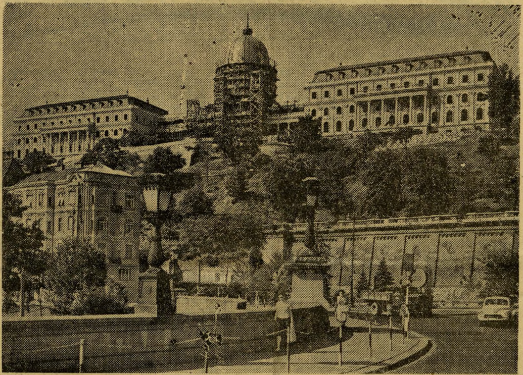
A Buda vári palota középrészének helyreállítási terve és az építkezés mai helyzete (Balassa Ferenc, Kácsor László felv.)

A budai vár kapuja sehol. A bejáratnál csak a fűvel benőtt paloták romjait látja az ember. A portásfülke melletti régi várfal darabba tört oszlopokat, márványlépcsőket fog körül.