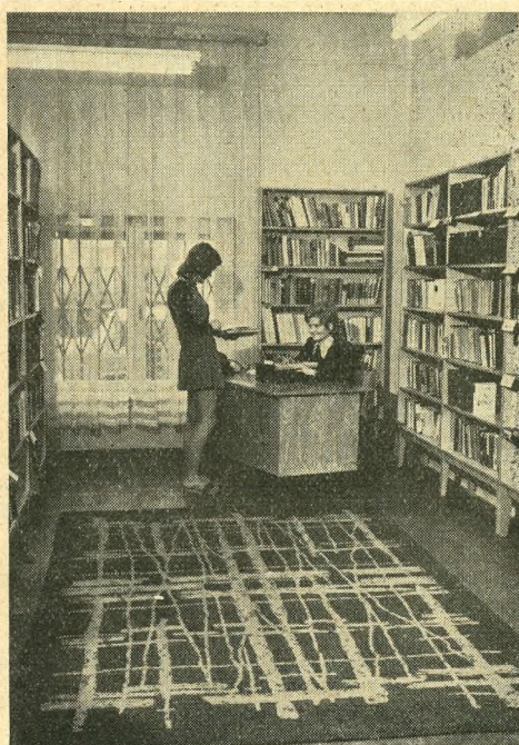
A vegyipari szakszervezet központi könyvtára az 1960-as években — és ma

borítóba kötöttek. Találunk egy-két kézikönyvet is, mint például a Társadalmi Lexikont.