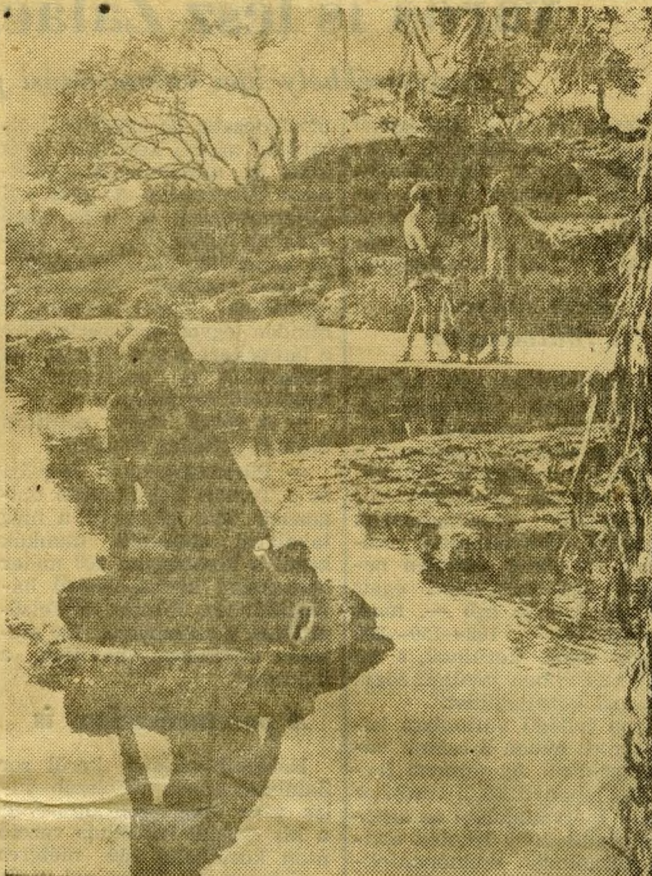
A japán kert

adománylevele már említést tesz a ferencesek, a domonkos és a johannita szerzetes rendek kolostorairól, valamint az esztergomi érsek váráról.