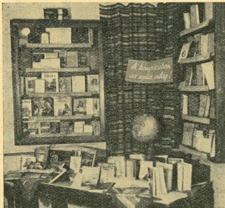
A »Könyvtárban az egész világ« című mintakiállítás a Fővárosi Szabó Ervin Könyvtár módszertani osztályán

A megvalósításnál felhasználtuk a világpolitikai sajtó propagálásának ismert formáját, a térképpel való összekötést.