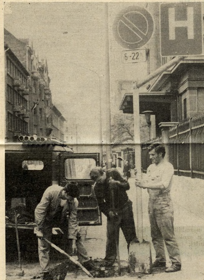
A Fővárosi Köztisztasági Hivatal táblagyártó üzemében készülnek a korszerű KRESZ-táblák. A vállalat táblakihelyező csoportja állítja fel ezeket a forgalmat irányító jeleket a közutakon

amelyeket akkor hallunk, amikor esőben mossák az utakat. Az első pillanatban észszerűtlennek tűnik, hogy a bőséges természetes csapadékot még művi úton is fokozzuk, de a valóságban nagyon is átgondolt, okos dolog ez. Az eső ugyanis segíti a Hivatal dolgozóinak a munkáját. Elvégzi az áztatást, fellazítja a lerakódott szennyeződést. Ilyenkor az 5–6 atmoszféri nyomású vízszugárral dolgozó munkagépek tökéletesen eltávolíthatják az úttestről a leta-