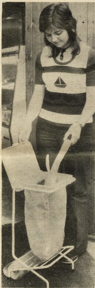
Kísérletképpen megkezdődött fővárosunkban a műanyag zsákos szemétyűjtés. Higiénikusabb és gyorsabb így a szemétszállítás

A lakóházakban ilyenkor kétszer annyi háztartási hulladék vár elszállításra, mint a téli hónapokban. Az úttesteket kiféheríti, elszínezi a lecsörgő vegyszeres víz, amellyel a gépkocsi-tulajdonosok mossák járműveiket.