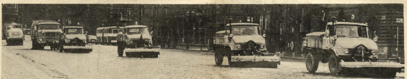
Seprőgépek csatasorban. Az UNIMOG típusú normál seprőgépek konvojban takarítják a Dózsa György utat. Az UNIMOG-okat locsolóautó követi, amely az útfelületet mossa. A sor végén önfelszedő seprőgép halad, a folyókában összegyűlt hulladékot távolítja el