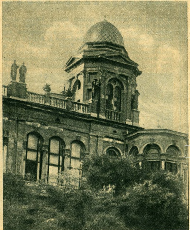
A Gül Baba-mauzóleum, amelyet az új épületóriás elzárta volna a világ elől.

Wagner Károly építész műve a Gül Baba-utca ormát díszítő, hatalmas palota. A Wagner-család azon- ban elköltözött Magyarországról s az épület, a rózsák aty- jának legendás sírjával együtt egy budapesti mérnöki vállalat birtokába került. A vállalat azonban áruba bo- csátotta. Eladó a pompás, árkádjain 40 klasszikus szobor- ral díszített palota — Gül Baba csendes hamvaival