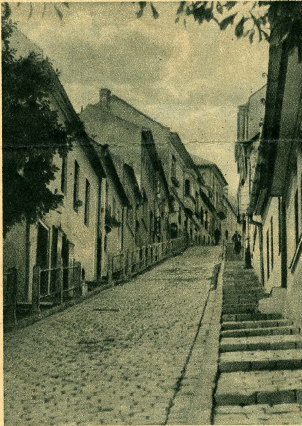
A kis Gül Baba-utca, amelynek több évszázados házasokai közé ötemeletes bérpalotát akartak építeni.

együtt . . . Kinálták már a fővárosnak, a török kormánynak — bevő azonban még nem akadt. Már így is ötemeletes paloták zárják el a szem elől, a Gül Baba-utcai vas- kapu berozsdásodott, mert a rózsák atyjának emléke, ugy- látszik megfakult egy kissé. Szerencse, hogy a Közmunka- tanács nem engedte körülvenni újabb ötemeletes kaszárn- yafallal, mert akkor még egy árva kupola sem látszott volna, amely alatt pedig valamikor százával jártak, imád- koztak turbános törökök és Európa minden tájáról erre té- vedt idegenek.