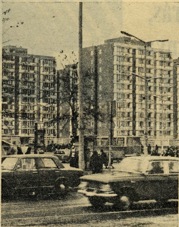
A XVII. kerület központja