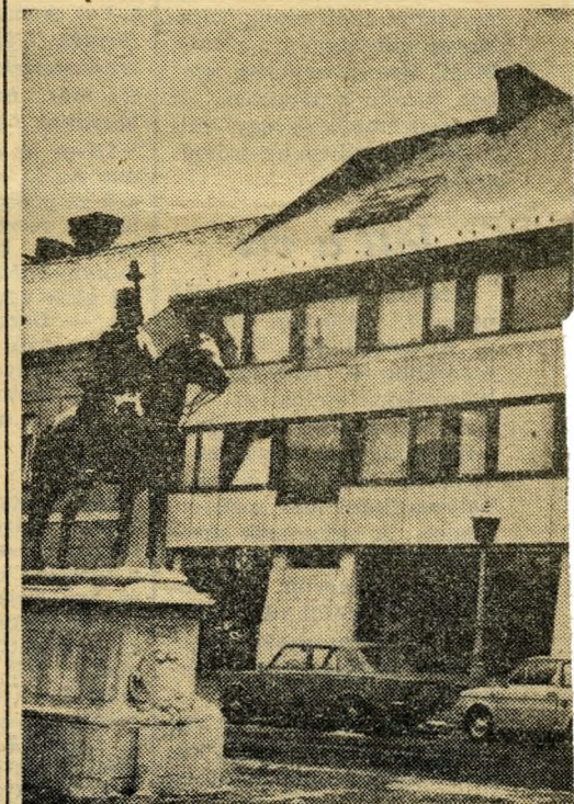
Üri utca 26—28. (Képeinken: idej