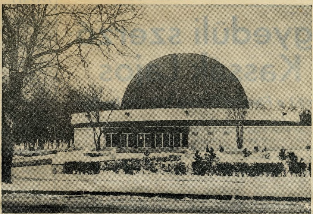
Planetárium a Népligetben