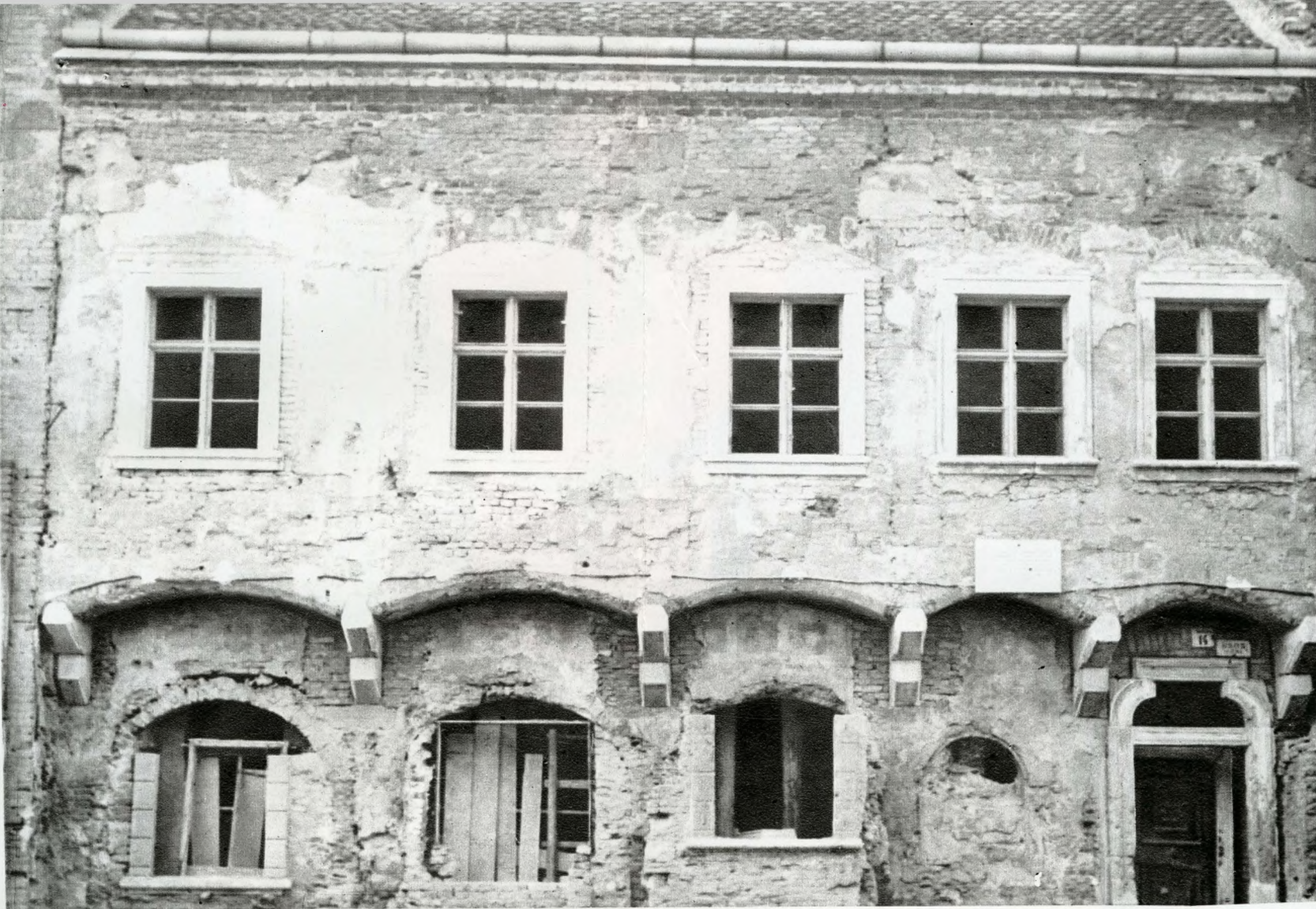
Az épület homlokzata helyreállítás közben, kibontott ívsorral (1951)

Eszpresszó az épület földszinti helyiségeiben. Az épület ma