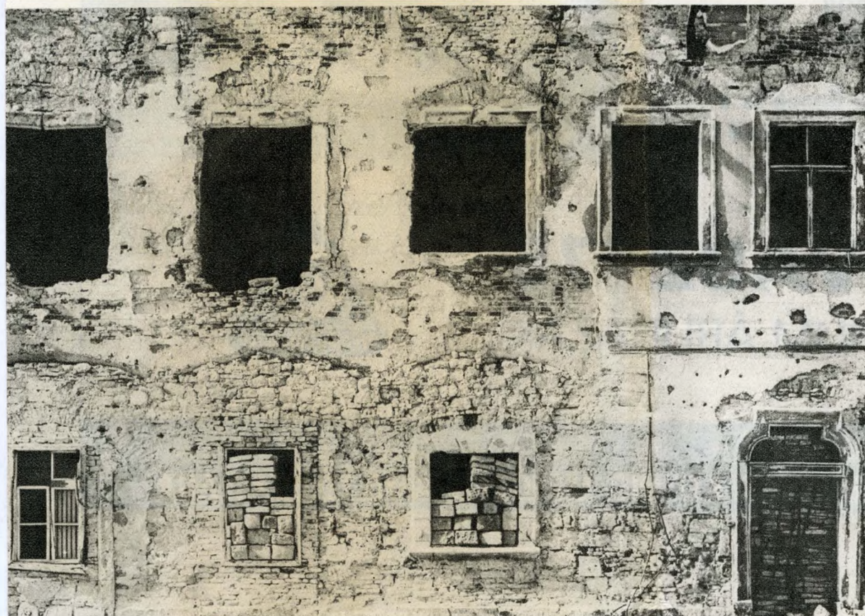
Az épület 1945. évi, romos homlokzata; a barokk vakolat alól eltűnnek az emeletet tartó gótikus ívek

Az I., Tárnok utca 14. számú épület nemcsak az ódon Várnegyednek, hanem egész Budapestnek egyik legérdekesebb lakóháza. Elsősorban meghitt hangulatú, török-boltozatos eszpresszója miatt közkedvelt. Homlokzatának értékes reneszánsz, gyémántmetszéses festése azonban még sokkal figyelemreméltóbb.