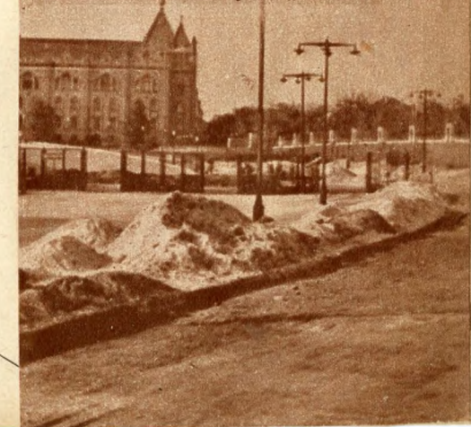
Az Ifjúság útja felüli oldalon is kiemelték már az új út „tükret”.