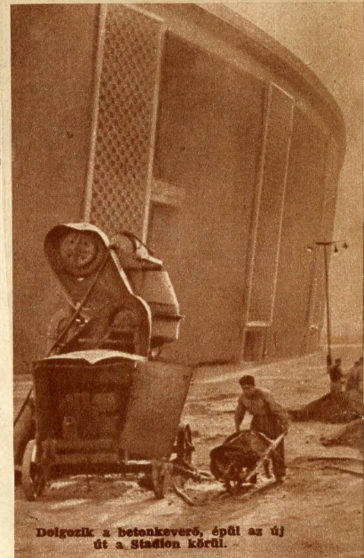
Dolgozik a betonkeverő, épül az új út a Stadion körül.

A „Kis stadion” földkötésje. Még ebben az évben folytatják a megkezdett földmunkákat.