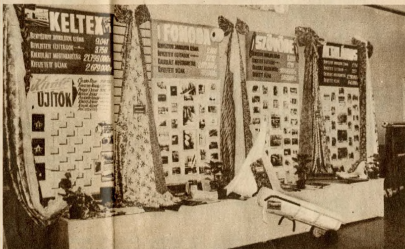
Tablókra, képeken mutatták be a KELTEX újítómozgalmának 25 éves eredményeit