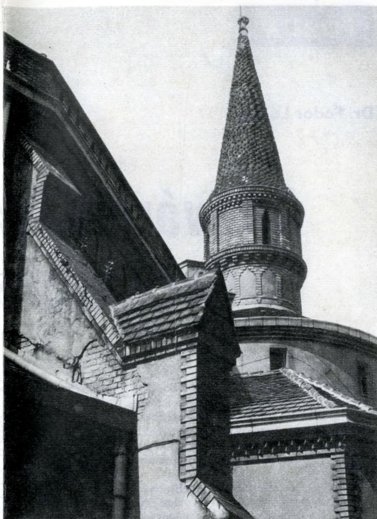
A Gólyavár épületének részlete

1954-től az ipari irányítás — a Forrás Nyomda korábbi profilját felélesztve — a vállalatot a folyóiratgyártás egyik bázisává is kijelölte. Az egyéb termékek közül jelentős a színes csomagolópapírok készítése. Adatszerűen: a 3300 tonnás évi termelésből 1500 jut a könyvekre (ezen belül 550 a tankönyvekre, 300–400 a rendkívül gondos szedést igénylő műszaki-tudományos könyvekre) és 1200 tonna a folyóiratokra. Megközelítően 1800