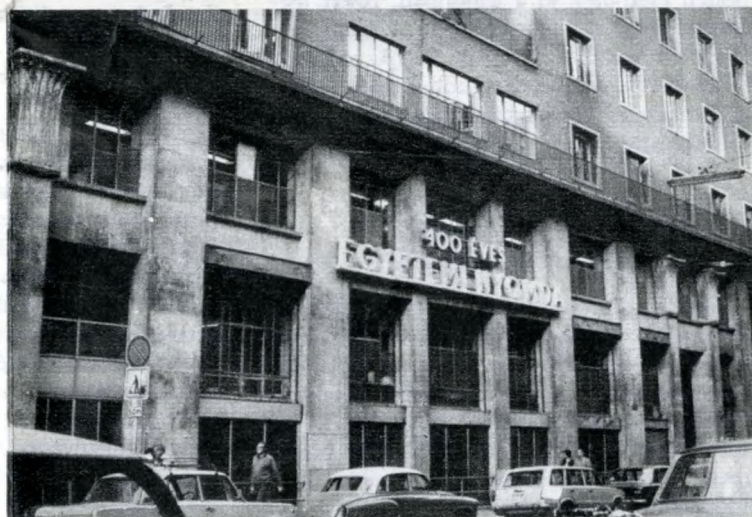
Az Egyetemi Nyomda épületének homlokzata

féle kiadvány készül itt. Ebből 60 folyóirat, főleg heti és kétheti megjelenésű, kis és közepes példányszámú periodika, éves összesítésben mintegy 16 millió példány.