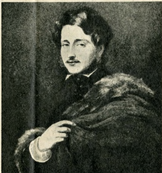
Károlyi György arcképe huszonnyolc éves korából