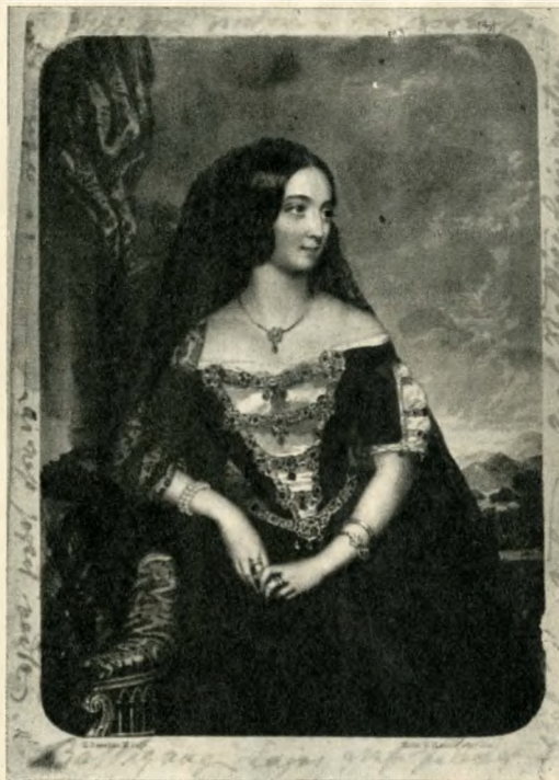
Batthyány Lajosné acélmetszetű portréja, körben a grófnő saját kezű irásával: „Batthyányi Lajos gróf felesége — szül. (... Zichy) Antónia. Gróf Batthyány Lajos vértanú — hazáért és a népért lett 1849 — kivégezve — a nép jogait védte”

A reformkori országgyűlések első sza-kaszában is hallatták hangjukat a magyar asszonyok, így Bonisné, Kendeffyné és Borsiczkyné (akit egy 1825. augusztus 14-i titkosrendőri jelentés így jellemezett: „ In-kább akarná, hogy az ura a spielbergi tömlöcben legyen, minthogy bármit is en-gedjen alkotmányunk jogaiból. ”) Szerve-zetten, nagyobb mértékben azonban Batthyány Lajos közéleti pályájával egy-idejében léptek a nők a küzdőterre. Batthyány az Ellenzéki Párt részére ké-szített programjavesztésében hangsúlyozta is: „ A hazaszeretet felgerjesztésére min-den veszélyeztetett nemzetrél hathatós