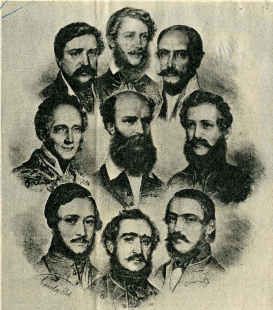
Batthyány Lajos, az első felelős magyar kormány miniszterelnöke és miniszterei. A felső sorban: Deák Ferenc igazságügy-miniszter, Kossuth Lajos pénzügyminiszter, Mészáros Lázár hadügyminiszter; a középső sorban: herceg Esterházy Pál, a (bécsi udvarral) közös ügyek minisztere, gróf Batthyány Lajos miniszterelnök, Szemere Bertalan belügyminiszter; az alsó sorban: báró Eötvös József vallás- és közoktatási miniszter, gróf Széchenyi István közlekedésügyi miniszter és Klauzál Gábor, a földművelés és az ipar minisztere

tenyésztés egyszersmind a földművelés többi ágát is tökéletesíti, és a kisajtott hulladék kiváló takarmány, kivált juhoknak". Széchenyi példájára a hazai szelvénytenyésztés előmozdítására 50 000 eperfát is ültetett. A pálinkaégetést azonban egyik jószágán sem akarta engedélyezni, mert attól tartott, hogy a pálinkaiváshoz szokott nép elbutul, eltompul és elaljasodik.