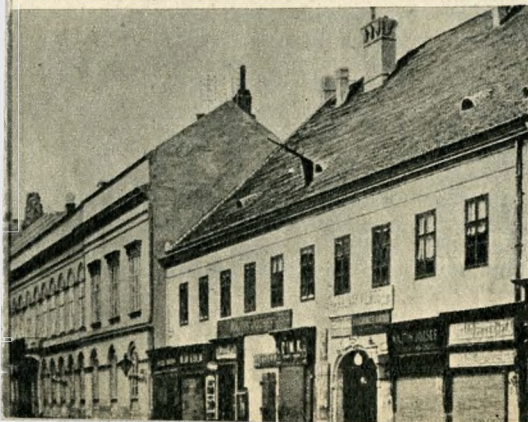
A Károlyi-palota — amelyben az ellenzék vezetői találkoztak — és a Harruckern-Wenckheim-ház Pesten a századfordulón