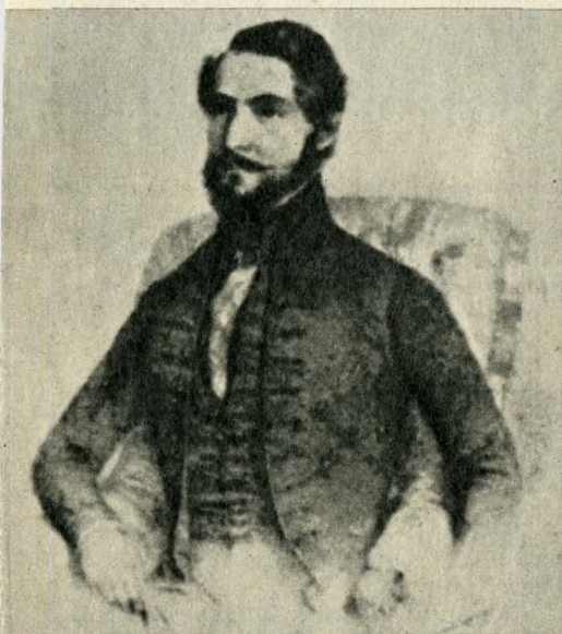
Batthyány Kázmér képe a németújvári családi képtárból