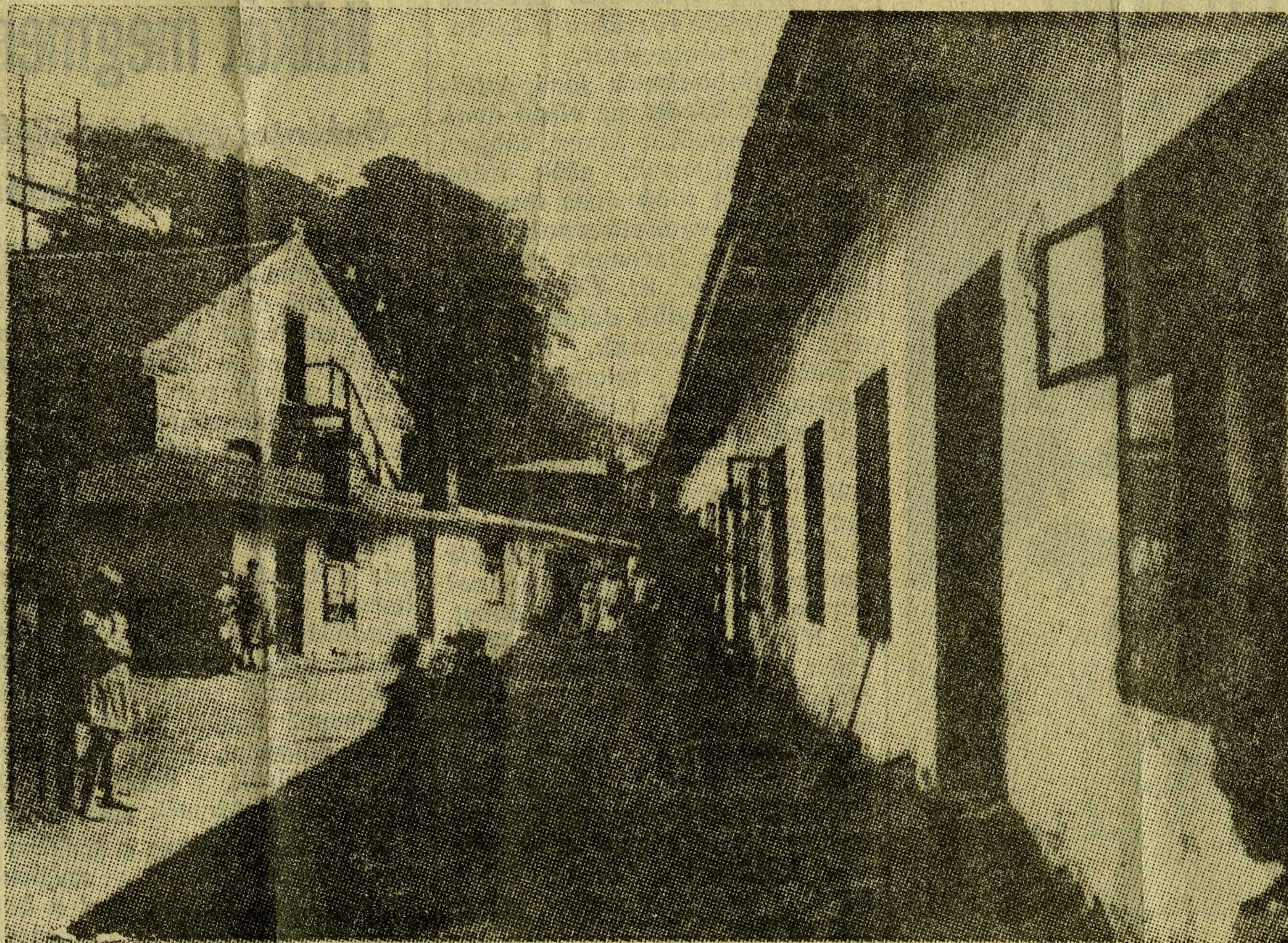
Angyalföldi munkáslakások a századforduló táján.

Azért kell nekünk — osztálytudatos húsipari munkásoknak — is, a többi szakmák példájára a tanoncok védelmét és szakképzését előmozdítani, hogy erőteljes és szívós bajtársakat nyerjünk a mi kemény küzdelmeinkhez.