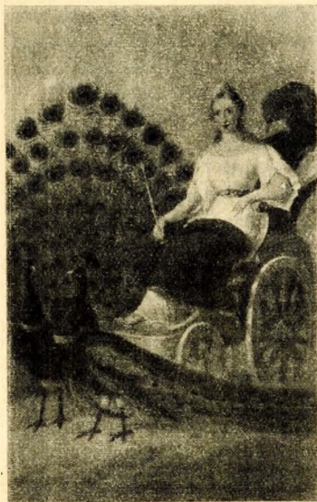
Johann Varschagh: Juno, Firmmentafel einer Ofner Drogenhandlung (jetzt im Hauptstädtischen Museum)

zweig gar nicht gegeben hat. Sie war der hohen Kunst so wesensverbunden, dass ihre Erzeugnisse nur als Werke der Malerei überhaupt gehandhabt und gewertet wurden. Ihre Spitzenleistungen stammen von den bekanntesten Malern der Zeit. Ihr zeitlich erster Vertreter ist Johann Varschagh . Seine bedeutendste Leistung ist die grosse Firmmentafel für die Wagnerwerkstätte Kölber ; die Tafel befindet sich heute im Hauptstädtischen Museum. Gegenstand der Darstellung ist das Kölber'sche Haus selber mit der Umgebung des zur Zeit der Entstehung des Bildes schon abgetragenen, somit nach einem ältern Vorbild gemalten Hatvaner Tores. Hiedurch ist einer der wichtigsten Anhaltspunkte für Topographie und Baugeschichte des alten Pest gegeben, der umso schwerer ins Gewicht fällt, als die hier dargestellten Bauobjekte zum Teile in viel ältere Zeit zurückreichen und auf dem Torbau selbst noch ein Abglanz der korvinischen Renaissance liegt. Das bewegte Leben davor bietet auch für das Kultur- und Kostümgeschichtliche Interesse Belege von eindringlicher Gegenständlichkeit. Ein weiteres Werk Varschags von ähnlicher Bestimmung war für eine