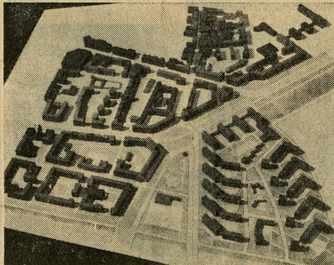
Ilyen lesz, ha teljesen kiépül, a sok ezer új lakást adó modern lágymányosi lakótelep