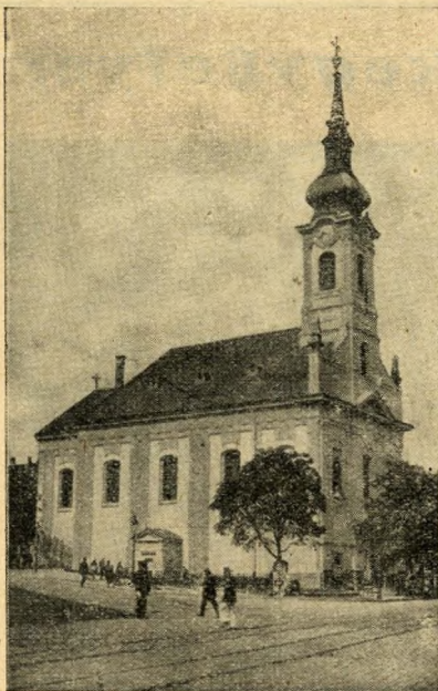
A krisztinavárosi templom kívülről.

hanem számtalan kétségbeesett megvizsgálója, a betegek gyógyítója és azonkívül egy új városrész alapköve.