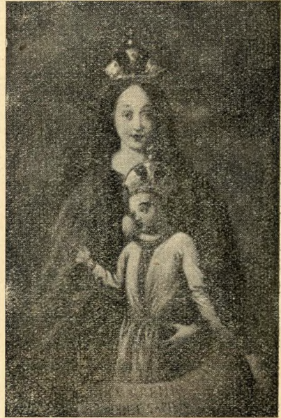
A krisztinavárosi kegykép.