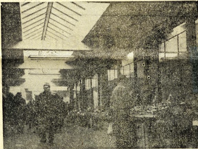
Az újat, a szépet hamar meg lehet szokni. Így van ez a piaccal is

egészséges lakóház, akár a Papp József utcában, akár a Pozsonyi útra, vagy a Baross utcára gondolunk. Vagy említhetnénk éppen az Izzó lakótelepét, amely a régi Károlyi uradalom cs-lelházainak a helyén épült és épül még sokáig.