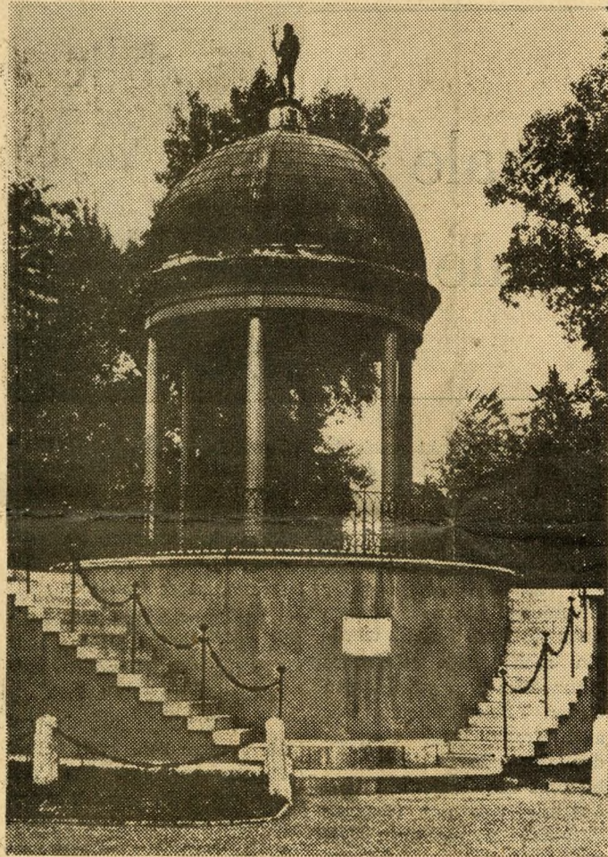
Spielbrunnen auf der Margaretinsel — Genuß für Augen und Ohren

Nach der Installation der Wasserleitung verloren die öffentlichen Brunnen ihre ursprüngliche Bestimmung. Doch bietet ein mit Statuen gezielter Brunnen auch heute noch einen attraktiven und stimmungsvollen Anblick.