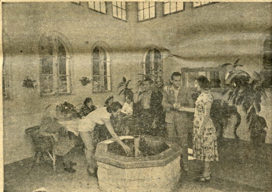
Sokféle betegség ellen kiváló hatású egy-egy pohár gyógyvíz