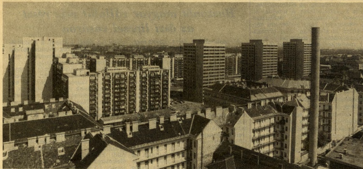
Az új — de még nem összkomfortosan.