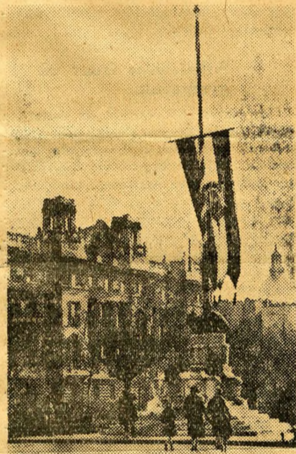
Flaggan på halv stång för de delar av Ungern, som bortskänktes i Trianon.

sig av ekonomiska katastrofer kan man ännu inte överblicka. Vi befinna oss än så länge mitt i brinnande världsfred. Man måste emellertid beundra den infernaliska virtuositet, varmed man där lyckats tussa alla nationer mot varandra, och den raffinerade skicklighet, varmed alla begrepp ställts på huvudet. Hela affären verkar nu som ett jättelikt pokerparti, där alla förlorat och ingen vunnit.