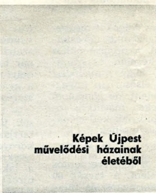
Képek Újpest művelődési házainak életéből