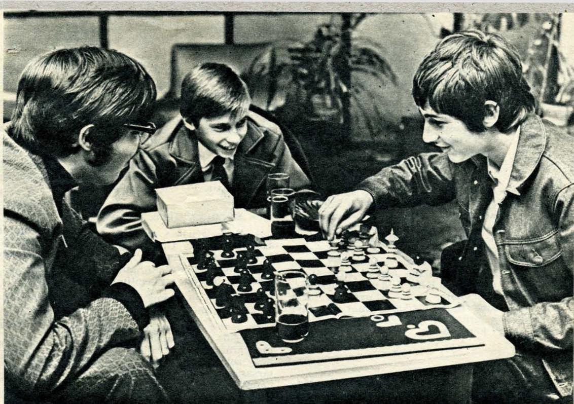
Általános iskolások a Duna Cipőgyár ifjúsági klubjában

— Sajnálom, hogy nem tudtam segíteni — búcsúzott a fiatalasszony. S valóban, telve kétségekkel jöttem el az Izzóból. Lehet, hogy mondvacsinált probléma görcseinek megoldását keresem?