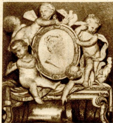
A Szép Juhászné cégére