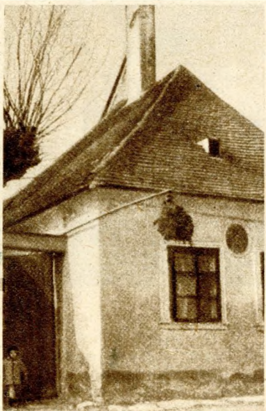
Szőlőműves ház Kőszegen