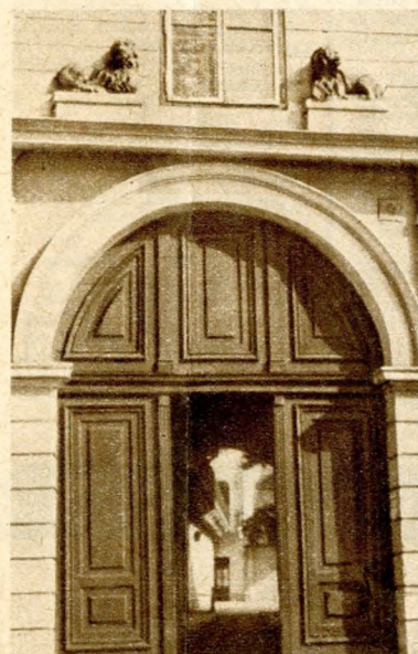
Híres a Kálvin téri két oroszlán