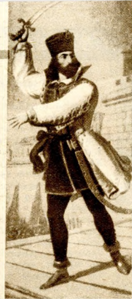
A Zrínyi kávéház cégértáblája