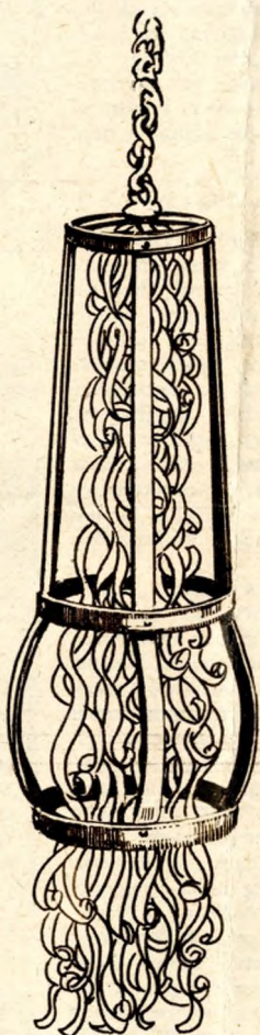
A Fehér Rózsa cégére

hetven esztendő emlék. A felvétel kőszegi bortermelő gazda házát ábrázolja, amelyre fenyőág-csomó van kitűzve annak jelül, hogy a háznál a gazda saját borát méri ki.