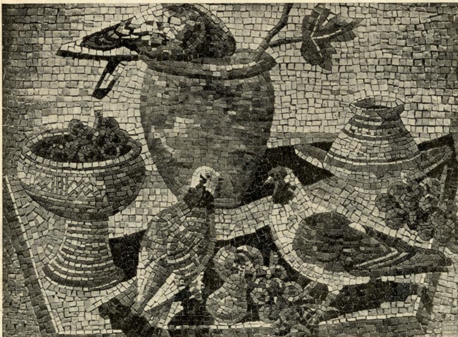
Severini : Csendélet