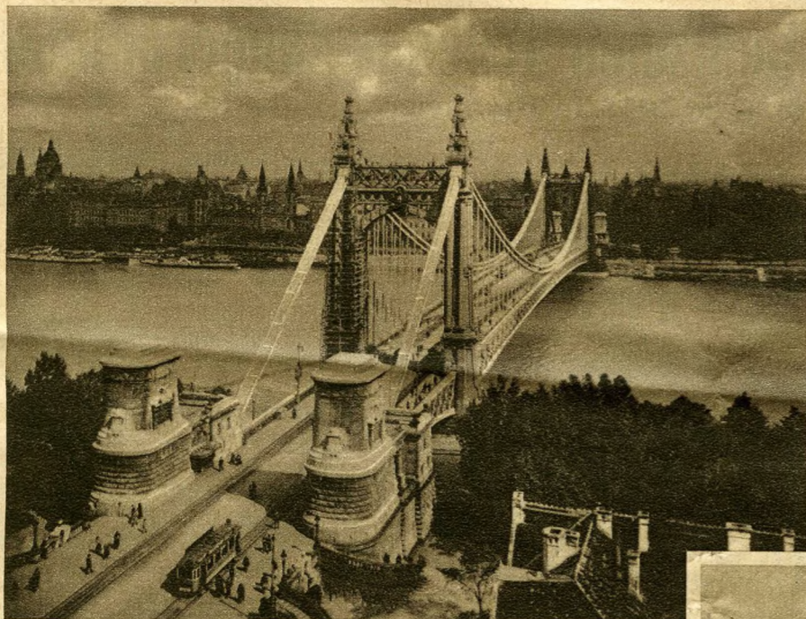
Die Elisabethbrücke

An beiden Ufern der hier schon breit dahinströmenden Donau erhebt sich die Hauptstadt der Ungarn, rechts Buda (Ofen), links Pest, zusammen Budapest, der Lage nach sicherlich eine der schönsten Großstädte des Kontinents. Hier muß man mit der Straßenbahn nicht wie in Wien bis an die Stadtgrenze fahren, um die ganz und gar nicht blauen Wellen des Flusses zu schauen, dem beide Städte ihre Entstehung verdanken. Der gewaltige Strom fließt mitten durch die Stadt, seinen Ufern entlang laufen die schönsten und belebtesten Spazierwege, auf denen Sommer wie Winter die groß-