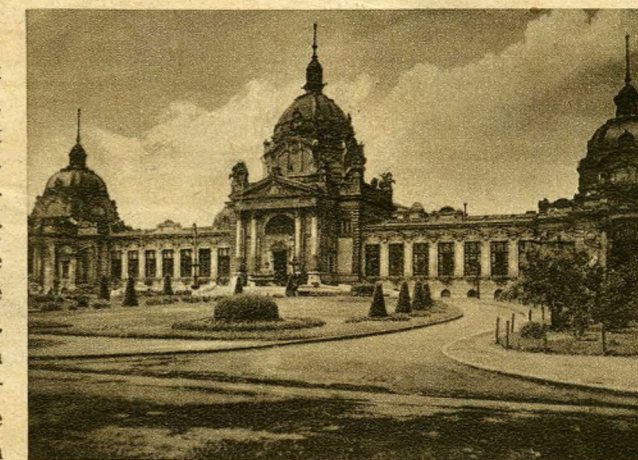
Das Szechenyi-Bad

Alle nicht gekennzeichneten Aufnahmen wurden uns von der Oesterreichischen Lichtbildstelle zur Verfügung gestellt.