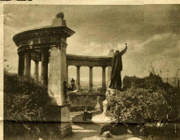
Denkmal des Bischofs Gerhard

den auf- und absummeln, hier recken sich nicht nur große Hotels, sondern auch monumentale Gebäude des öffentlichen Lebens empor — wir sind im Herzen der Stadt. Das Parlament steht hier mit seinen vielen Türmchen und die Ofener Burg spiegelt ihre Hunderte von Fenstern in dem träg dahinfließenden Wasser. Deshalb empfiehlt es sich auch, nach Budapest nicht mit der Eisenbahn zu fahren, sondern diese Flußstadt vom Deck eines der vielen Schiffe zu begrüßen, die alltäglich in eintägiger Fahrt ein der Nationalität nach meist äußerst bunt zusammengewürfeltes Publikum von Wien in das, wenn man Glück hat, von der Abendsonne vergoldete Häusermeer Budapests tragen. Da erst entrollt sich dem Reisenden ein Stadtbild, das dem von Dresden, ja nicht einmal dem von Prag nachsteht. Der langgestreckte Bau des Parlamentes mit seiner überladenen Gotik wirkt in dieser Umgebung nicht nur erträglich, sondern beinahe imposant. Zahlreiche Brücken spannen