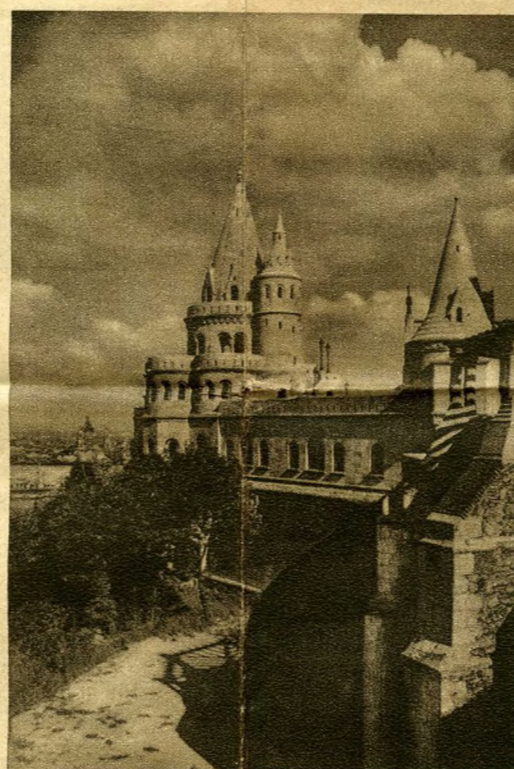
Fischerbastei Unten: Bauernpaar aus der Umgegend von Budapest