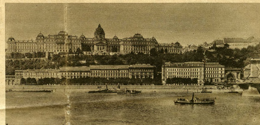
An der Donau