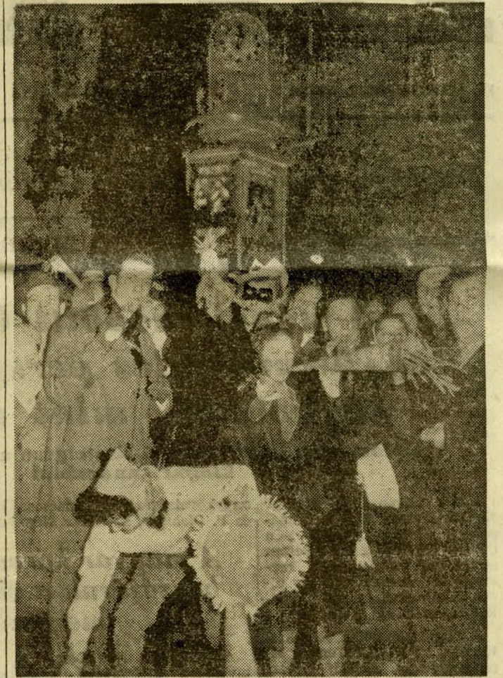
Sokan énekelték Szilveszter éjszakáján, hogy „egyre miavárom a Nemzetinél...” Fotoriporterünk is ezt látta az új év első óráiban

Igy búcsúzott Budapest, az ország, minden hazánkfia a sikereiben gazdag esztendő-től, így köszöntötte az új évet! Nagy Lajos