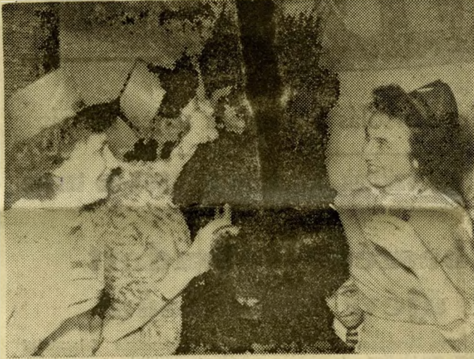
Valódi csókot kapott az alkéményseprő már a kora esti órákban Budán, a Hársfa családi-kisvendéglőben

Ismét elbúcsúztattunk egy esztendőt, s vidám ünnepléssel fogadtuk a helyébe lépő fiatal új évet. Igaz, öregebbek lettünk egy évvel, de ismét gazdagabbak sok szép élménnyel, sikerrel, melyre évtizedek múlva is szívesen emlékezünk majd vissza. Az eredményekben gazdag esztendő megérdemelt, vidám búcsúztatásra, az új év köszöntésére. Budapest hatalmas bálteremmel alakult. Az „előszilveszter” már a délutáni órákban megkezdődött: a hivatalokból, üzemekből kiáramló dolgozósereg, mielőtt hazaindult, kollégákkal, barátokkal koccintott az új év sikerére.