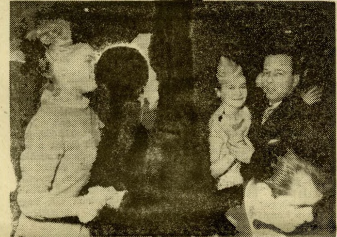
Éjfél előtt a Hungária Kávéház nagyszabású nemzetközi bálján. A vidám hangulatban kitűnően szórakoztak csehszlovák vendégeink is

— Bármit kérjenek — fogad bennünket a szálló vezetője —, csak ülőhelyet ne, mert még számolyt sem tudok adni. Belga vadászok, nyugatnémet, román és csehszlovák vendégek emelik poharukat a szilveszterezőknak egy-egy darabkát.