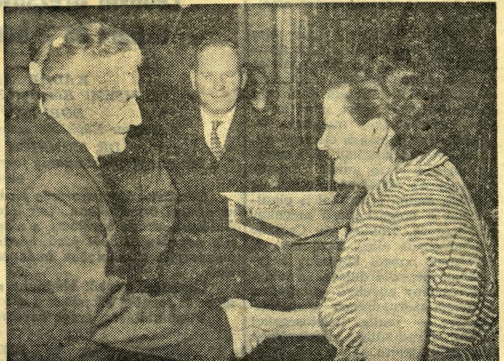
Novotny elvtárs a nagylámpagyártás egyik dolgozóját üdvözl.

A munkásosztályra hárul az a feladat, hogy állandóan szilárdítsa a munkásság, a parasztág és az ér-