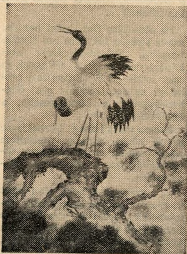
Darvak fenyőágon (Selyemhímzés)

Sokan gyönyörködtek a kiállított tüfestményekben, a selyemhímzésekben. E hímzések a festmény tökéletes illúzióját keltik az emberben, holott a művész nem ecsettel és palettával, hanem tűvel és színes selyemszállal dolgozik. E hímzések ámbár alapvető technikájukat illetően azonosak az ismertebb kínai képekkel, mégis mások, mint azok: Koreaiak. Az egyik legszebb darab talán a Darvak fenyőágon című.