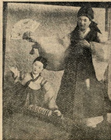
Szerelmes pár (Népviseletes bábuk)

A kiállításon nemcsak dísz tárgyakat, hanem használati eszközöket is bemutatnak. Színpompás ruhákat, a mindennapi életben használt fém- és cserépedényeket, ládákat, asztalkákat. E tárgyak díszítése egynemű, mentes minden hivalkodástól, üres technikai bravurtól. De éppen ez az egyszerűségében is kifejező szépség az, amely a látogatóra a legmélyebb benyomást teszi, mert érzi, hogy ezek az alkotások nem válnak divatjamúlttá, hiszen létrejöttüket nem egy műlékony művészeti irányzat felkapottságának, hanem az életet gazdagabbá tenni igyekvő, a népből való, attól el nem szakadó művészek és mesterek alkotó kedvének köszönhetik.