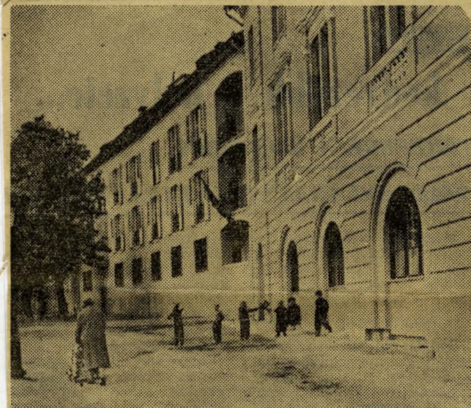
Helyreállított épületsor a Bástya-sétányon

palota épületén már elvégzések a hátramaradt szerkezeti átépítéseket, állnak már a válaszfalak, és folynak a belső építkezési munkálatok.