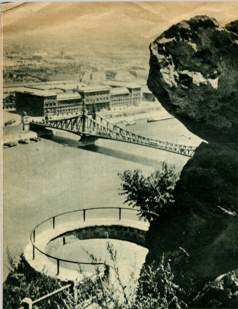
Gellérthegy részlet.

MÉGIS. MENNYIRE BUDAPESTHEZ tartozik ez a megyeháza, érzi az ember, mikor egyik udvarán vörösmárványba vésett feliratot olvas, amely így szól: «A vármegyeházának ez ódon falai nyöglék a nagy szultánok világverő hadait, de látták Buda és Pest felszabadítását is az idegen járom alól 1686-ban. Pedig a vármegyeházának csak ezek a régi udvari részei lehetnek kétszázötven évnél idősebbek, mert a városházutcai frontja csak 1838-ban épült meg. Mennyire magyar sorsszerűség mutatkozik meg abban is, hogy az egykori Gránátos-utcára nyíló telket úgy kellett visszavásárolni kemény négyezer forintokért Puchnek Rikárd császári hadbiztostól, aki az osztrák kincstártól kapta — ajándékba. Pest városa vette meg a telket a hadbiztostól s tőle szerezte meg a megye, hogy felépítse a telken és a rajta lévő romokon az új vármegyeházát. A magyar földet, a magyar vérrrel szerzett területet még aranyakkal is meg kellett fizetni.