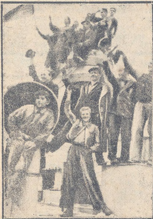
Nagy lelkesedéssel búcsúztatják a kifutó hajót a gyár dolgozói

Önnepélyes keretek között vette át a szovjet átvevőbizottság a „Rákosi Mátyás” elvtárs nevét viselő 400 lóerős folyami gőzhajót az Óbudai Hajógyár dolgozóitól.