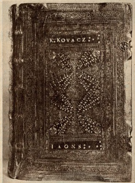
Károli Gáspár Új Testamentumának kolozsvári kötése 1661-ből.