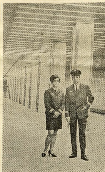
Nová uniforma zamestnancov METRA

nou a miestnou dráhou 4 miliónov ľudí. Prudko sa zvyšuje aj počet vozidiel, čo pôsobí nemalé starosti odborníkom verejnej dopravy. Na úseku, ktorý odovzdajú, sú štyri pohyblivé schody, dve nadzemné stanice a jedna stanica pod dlažbou. Pohyblivé schody dopravia cestujúcich do hĺbky 30 metrov. Pri cestovaní metrom budú platné len abonentné lístky. Cestujúci, ktorí mesačný lístok nemajú, hodia forintovník do automatu, ktorý pomocou fotocely uvoľní cestu. Na prvom úseku budú premávať troj-štvorvozňové súpravy, ale v prípade úplného využitia 120 metrov staničnej dĺžky môžu premávať súpravy so 6 vozňami. Do jedného vozňa sa zmestí 170 osôb.