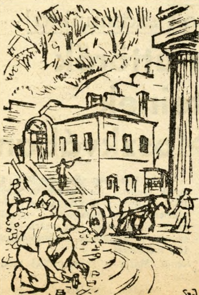
Lebontják a Síklőt