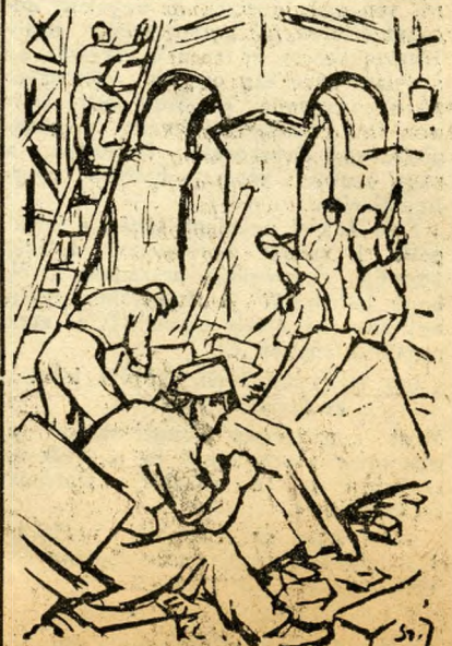
Épül a Kioszk